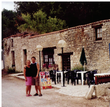
Camping « le LIZOT »